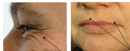
plooien en rimpels in het gezicht