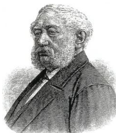
Dr. W.H. Schüssler (1821-1898)

Onder de lage D-potenties bestaat een speciale groep middelen: de Schüssler celzouten. Mogelijk heeft u daar wel eens van gehoord, maar wat zijn deze celzouten?